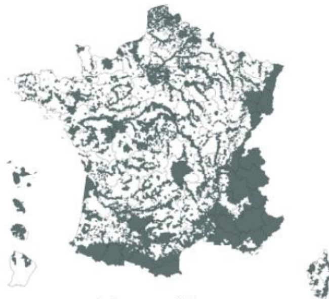
carte des communes de France où s'applique l'obligation d'établir un état des risques

Pour plus d'informations, écrivez à l'adresse courriel ddtm-serdd-pr@alpes-maritimes.gouv.fr ou à l'adresse postale DDTM06 – SER – Pôle risques CADAM BP 3003 06201 Nice cedex 3