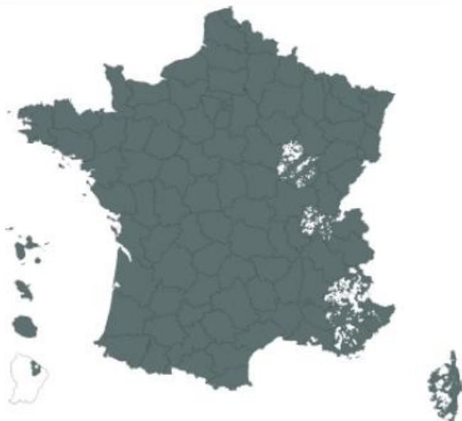
carte des communes de France ayant fait l'objet depuis 1982 d'un ou plusieurs arrêtés de reconnaissance de l'état de catastrophes